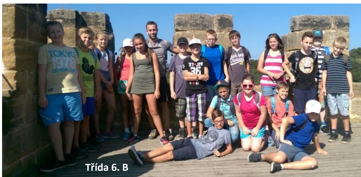
Třída 6. B